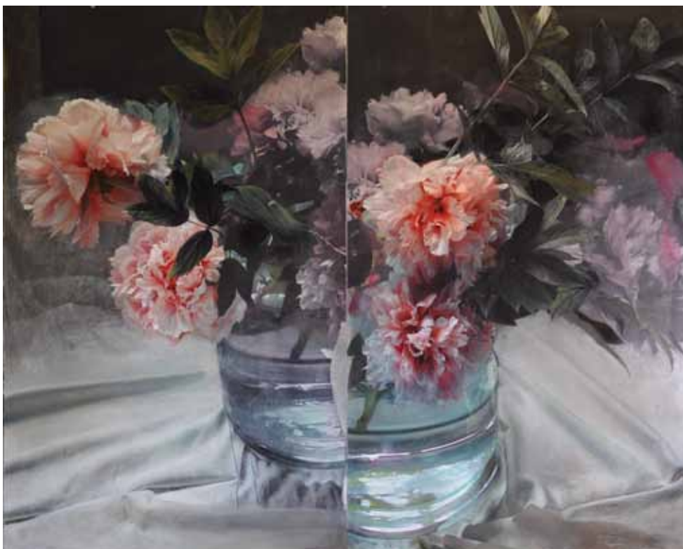
Doriano Scazzosi Peonie tecnica mista su tavola cm 180 x 145 (dittico) 2011