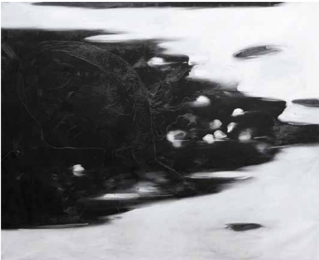
Omar Galliani Bianco titanio olio su tela cm 200 x 250 2011