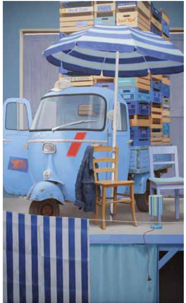
Paolo Quaresima L'ape regina (e la torre di babele) olio su tavola cm 250 x 150 2011