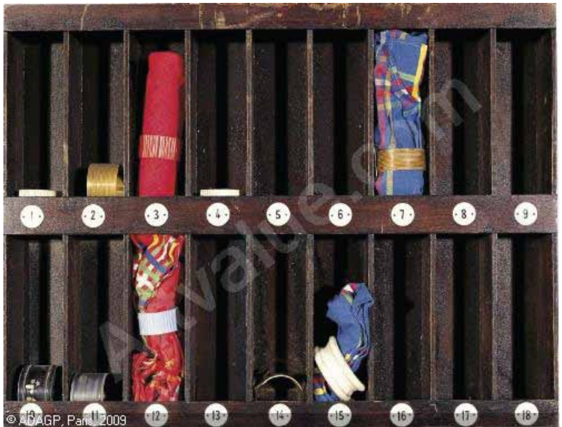
Daniel Spoerri La ronde des serviettes assemblaggio 1962, Courtesy Collezione Guido Peruz