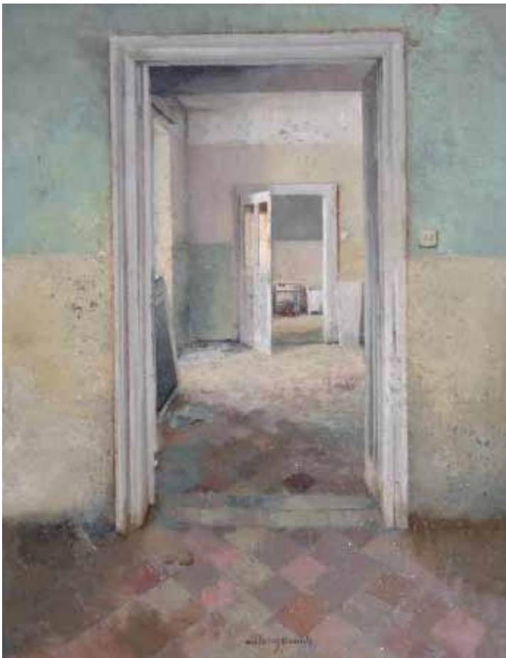
Matteo Massagrande Interno (550) tecnica mista su tavola cm 50 x 40 2009