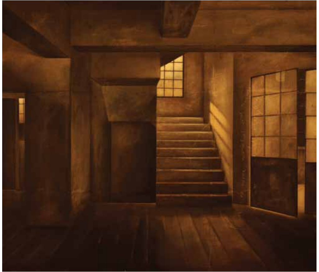
Carla Bedini Stanza n° 9 Dublino tecnica mista / garza cm 95 x 110 2007