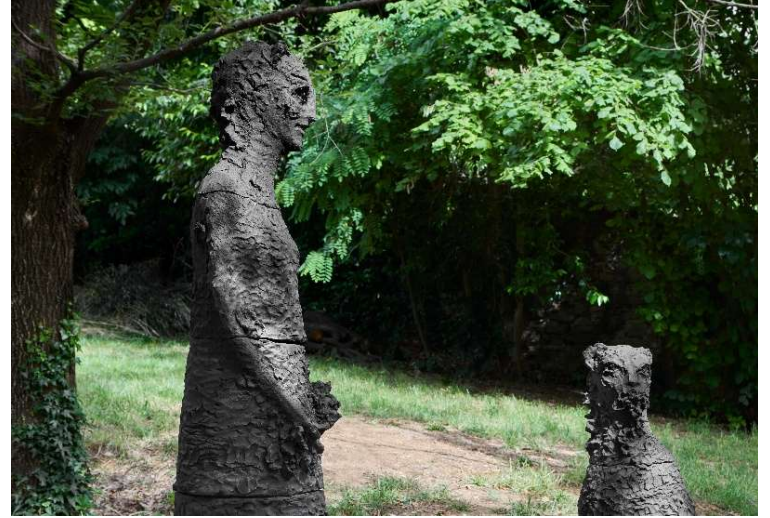
FIGURE NEL PAESAGGIO